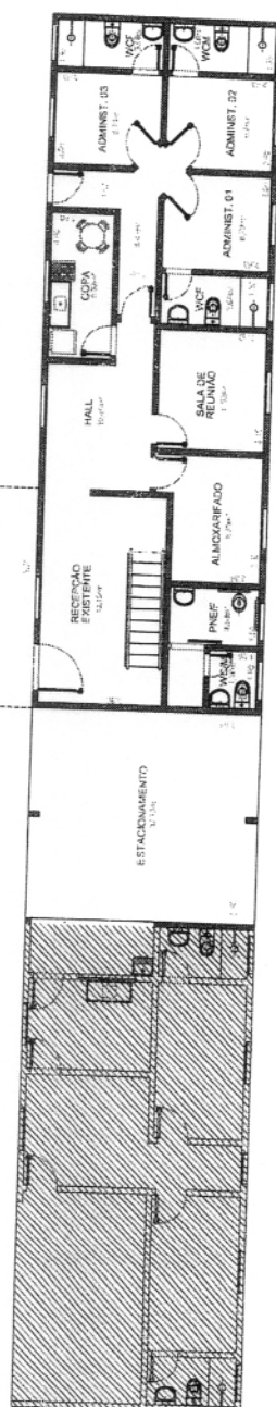
PLANTA - PAVIMENTO TÉRREO